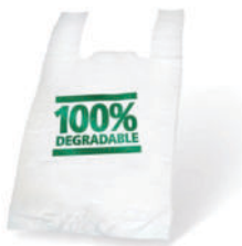
Bio Plastic Bag -2 kg