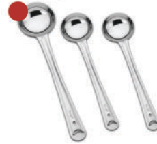
Steel Large Spoon