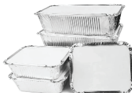
Poha Parcel Bowl -2 Pack