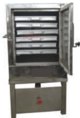
Live Dhokla Machine 6 Tray (Burner /Heater)