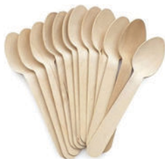
Wooden Spoon -2 Pack