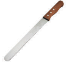
Bread Cutter Knife-2