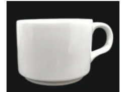
Tea Cup 80ml-48p