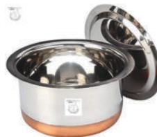
Small Steel Pot-10