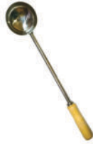
Large Steel Spoon with Wooden Handle