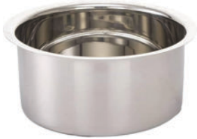
Steel Patila-2 (2 Small)