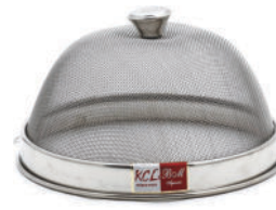
Steel Food Dome