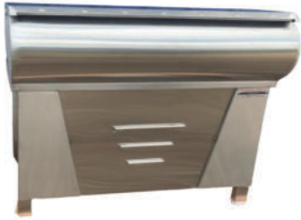
Khichdi Table With Full Setup