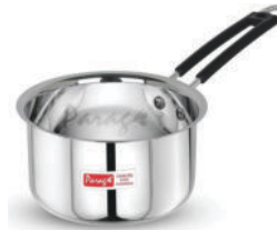
Steel Tea Pot-4