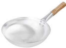
Tadka Fry Pan