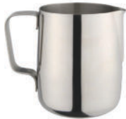
Steel Handle Jaar