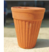
Kulhad Cup -500p