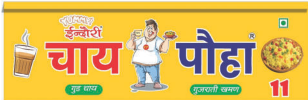
YUMMY INDORI CHAI POHA BOARD