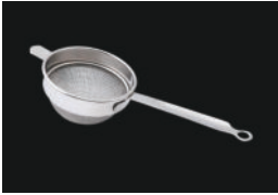
Steel Tea Strainer-2