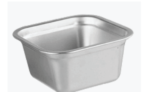
Dhokla Chatni Bowl -2