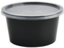
Plastic Bowl 500grm-100