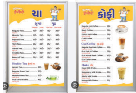
Clip-on Menu Boards (2-3 Design) – 4 pcs