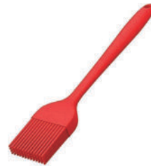
Silicon Spoon Brush-2