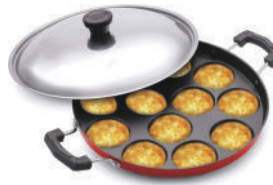
Non Stick Appam Kadai