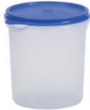
2 kg Plastic Container-10