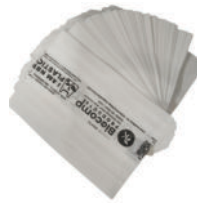
Tea Parcel Bag -2 kg