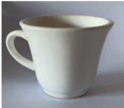
Tea Cup 50ml-96p