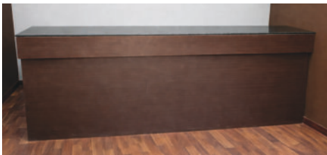
Wooden Cash Counter