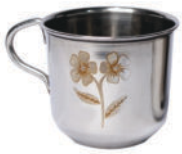
Tea Parcel Maap-4