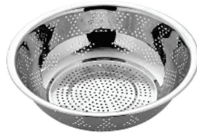
Steel Poha Strainer